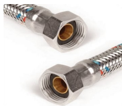
Malha de aço F/F