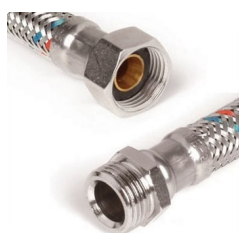
Malha de aço M/F